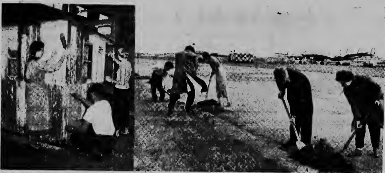
Op de Luchthaven Schiphol werken op het ogenblik een vijf en dertigtal buitenlandse studenten, die daar druk bezig zijn met diverse onderhoudskarweitjes.